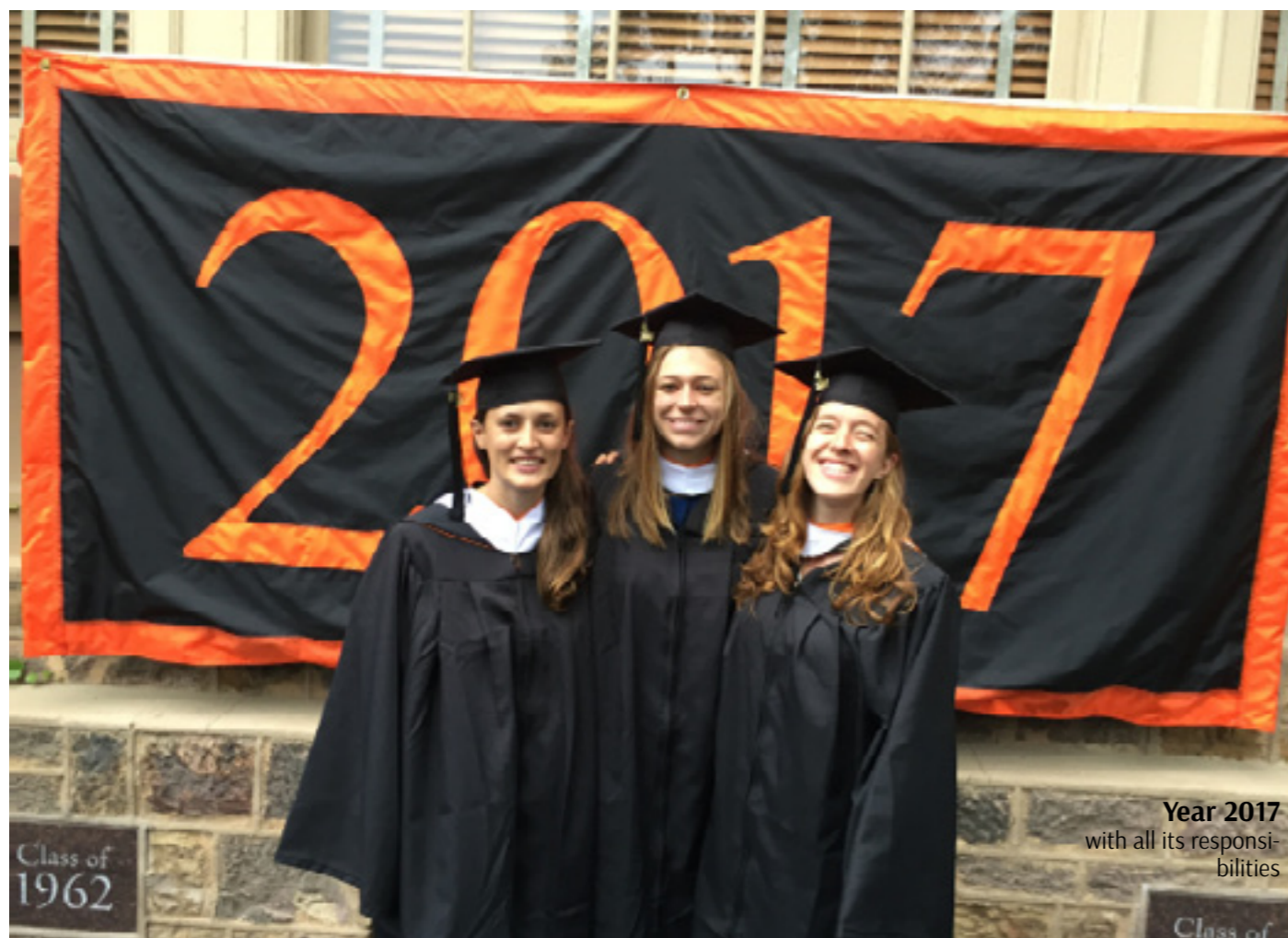
Year 2017 with all its responsibilities

MAKING MISTAKES IS A NORMAL PART OF LEARNING A LANGUAGE, AND IT'S ALWAYS BETTER TO SAY SOMETHING WITH MISTAKES THAN TO SAY NOTHING AT ALL.