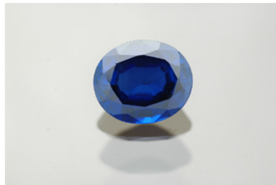
Foto mého nálezu safíru z letošního léta, Jizerská louka – Safírový potok