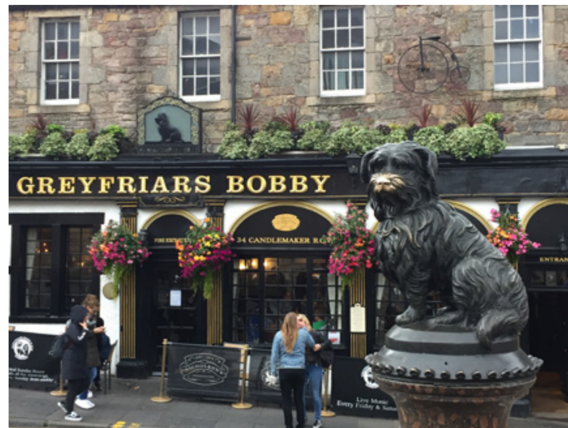
Soška psa Bobbyho který i po smrti svého pána chodil hlídat jeho nový podzemní dům

Další den už se musíme rozloučit s naší úžasnou rodinou, všichni se objímáme a v duchu jim děkujeme za jejich odblešenou kočku. Cestou zpátky se zastavujeme v kapli, kde je uložen svatý grál, a v odpoledních hodinách nastupujeme na trajekt. Teprve tam si uvědomím, že mě žádný akcent vlastně vůbec netrápil... ●