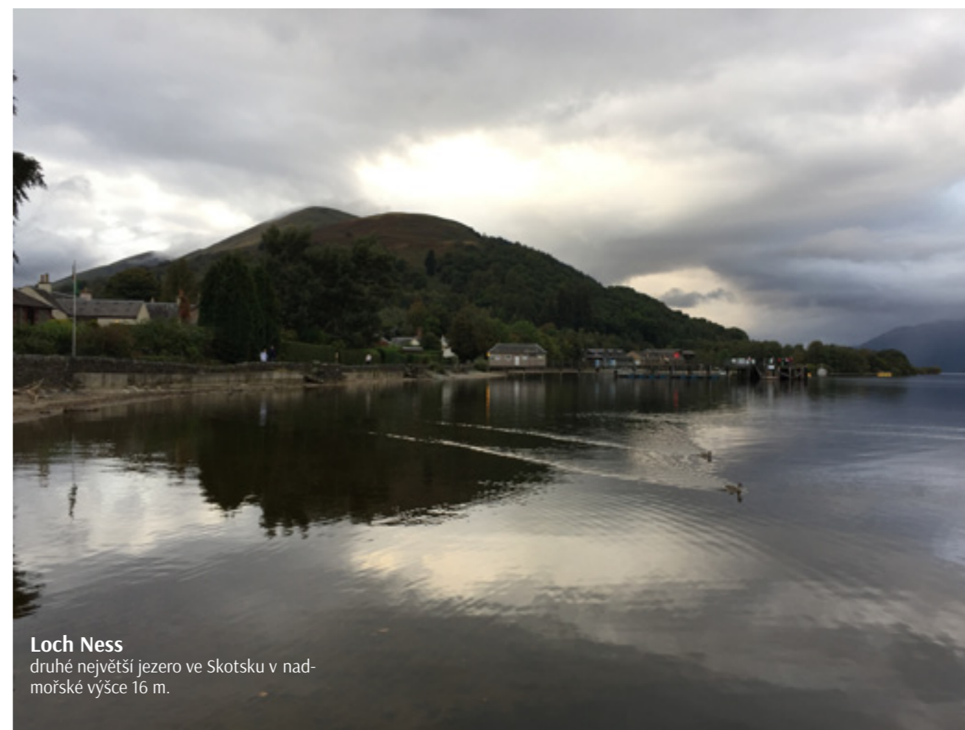
Loch Ness druhé největší jezero ve Skotsku v nadmořské výšce 16 m.