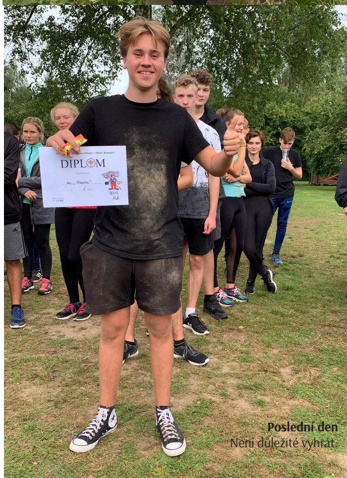
Poslední den Není důležité vyhrát.