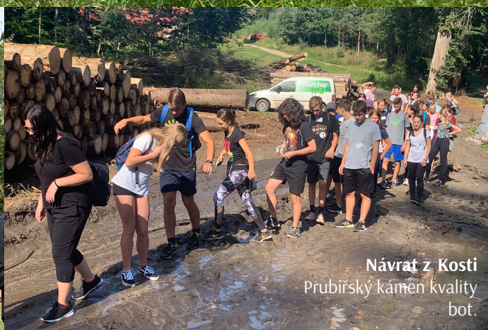
Návrat z Kostí Prubířský kámen kvality bot.