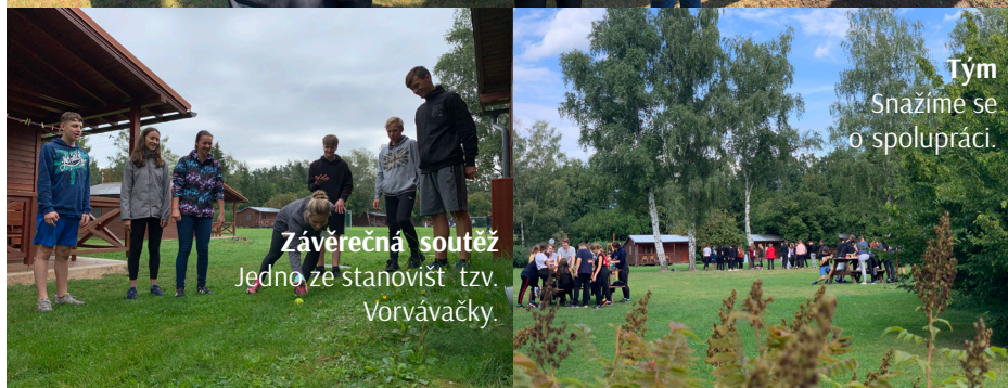
Závěrečná soutěž Jedno ze stanovišť tzv. Vorváčky.