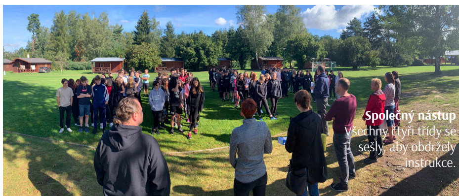
Společný nástup Všechny čtyři třídy se sešly, aby obdržely instrukce.