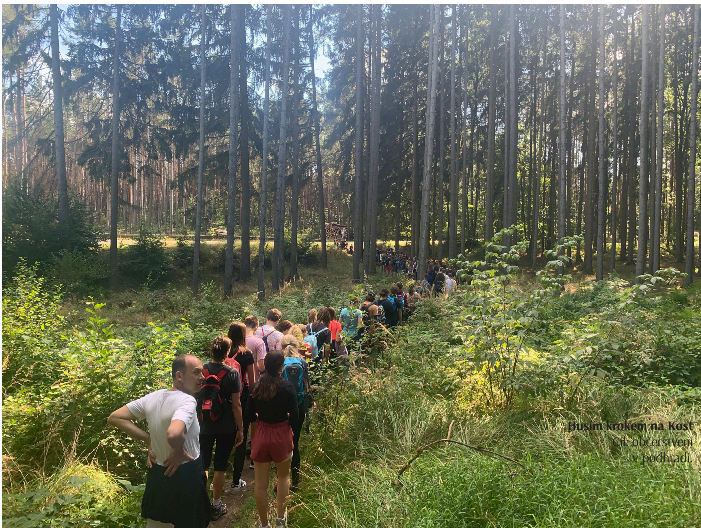
Husím krokem na Kost Cítí občerstvení v podhřadí.