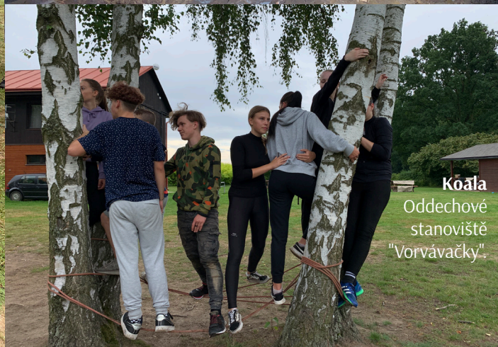
Koála Oddechové stanoviště "Vorvávačky".